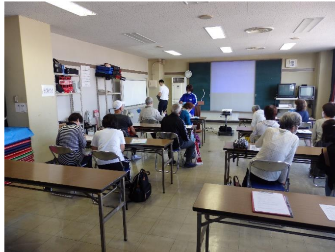
県担当者の終了挨拶