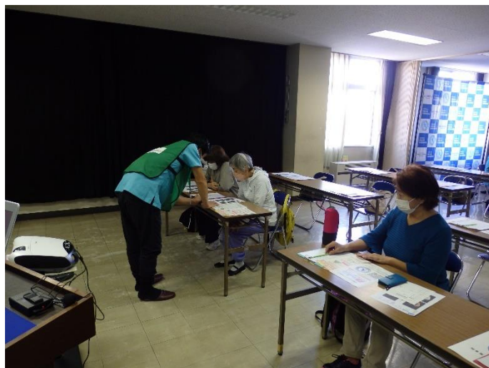
測定結果評価・解説