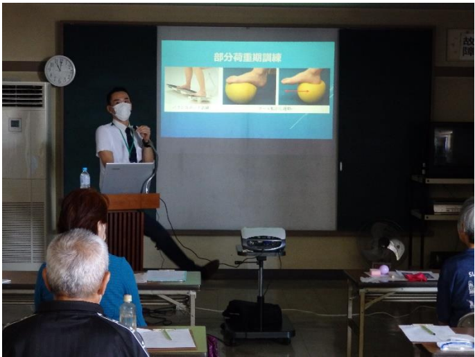
エクササイズ解説状況