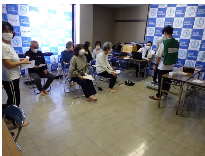
エクササイズ後の足底測定状況