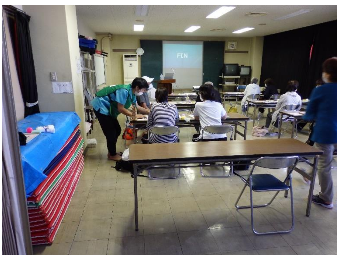
エクササイズ後の測定結果の評価・解説