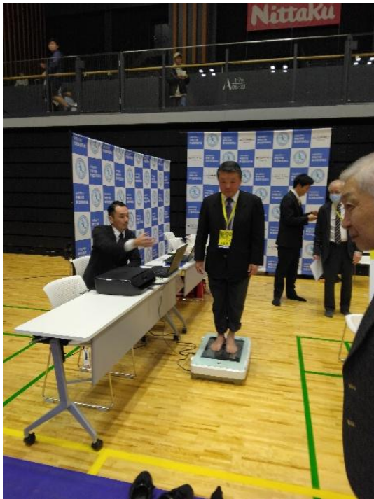
大会実行委員長の足底測定状況