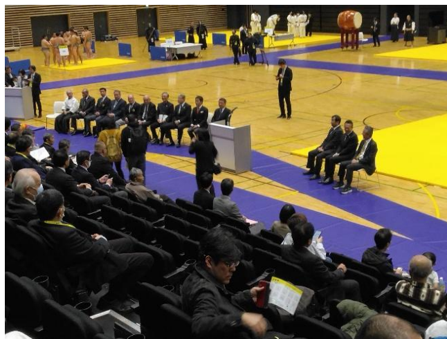
開会式リハーサル状況