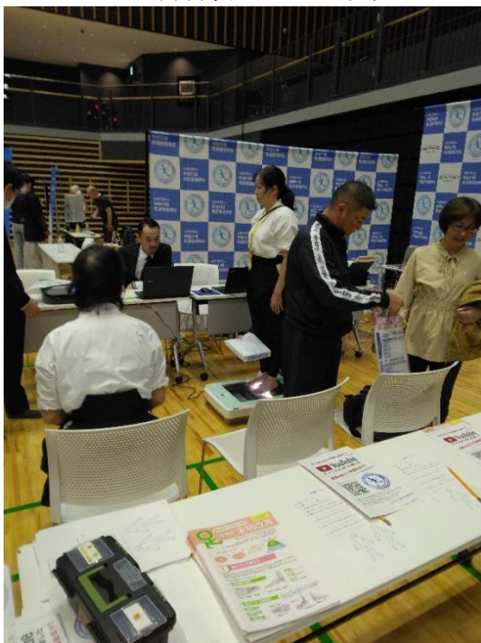
武道アスリートによる足底測定