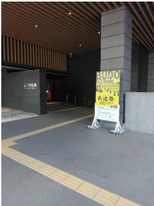
横浜武道館正面玄関周知立て看板設置状況