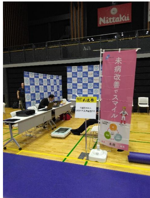
本会ブースの状況