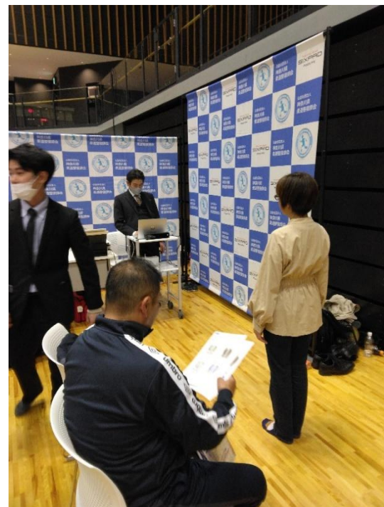
赤外線測定器による姿勢測定状況